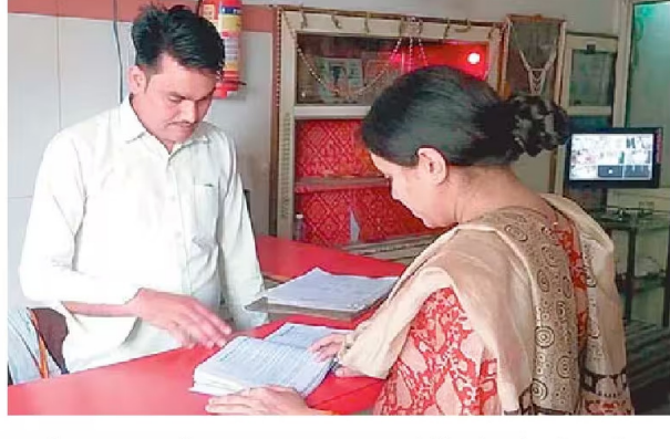
आपत्तिजनक सामग्री जरूर बरामद हुई। पुलिस ने होटल संचालकों को सख्त निर्देश दिए कि वे अपने यहां ठहरने वाले प्रत्येक व्यक्ति की पूरी जानकारी रजिस्टर में दर्ज करें। कार्रवाई के दौरान लक्ष्मणपुरा और आसपास के क्षेत्रों में अफरा-तफरी का माहौल रहा। बताया गया है कि पूर्व में जीआरपी द्वारा भी इस क्षेत्र में संदिग्ध गतिविधियों की शिकायत पढ़ाव थाना पुलिस से की गई थी।

ग्वालियर रेलवे स्टेशन के प्लेटफार्म-4 के बाहर लक्ष्मणपुरा कलारी के पास संदिग्ध गतिविधियों की लगातार मिल रही शिकायतों के बाद पुलिस ने मंगलवार को अचानक सख्त कार्रवाई की। एएसपी अनु बेनीवाल के नेतृत्व में पुलिस बल ने मौके पर पहुंचकर क्षेत्र में सख्त चेकिंग अभियान चलाया। पुलिस के पहुंचते ही फुटपाथ पर खड़ी महिलाएं भाग खड़ी हुईं, जिससे इलाके में हड़कंप मच गया। एक युवती को रोककर पूछताछ की गई, लेकिन उसने किसी भी अनैतिक गतिविधि में शामिल होने से इंकार किया। इसके बाद पुलिस टीम ने आसपास स्थित गेस्ट हाउस, लॉज और होटलों में तलाशी अभियान चलाया। जांच के दौरान किसी महिला के मौजूद होने की पुष्टि नहीं हुई, हालांकि कुछ स्थानों से